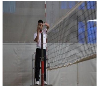
學生裁判實務學習