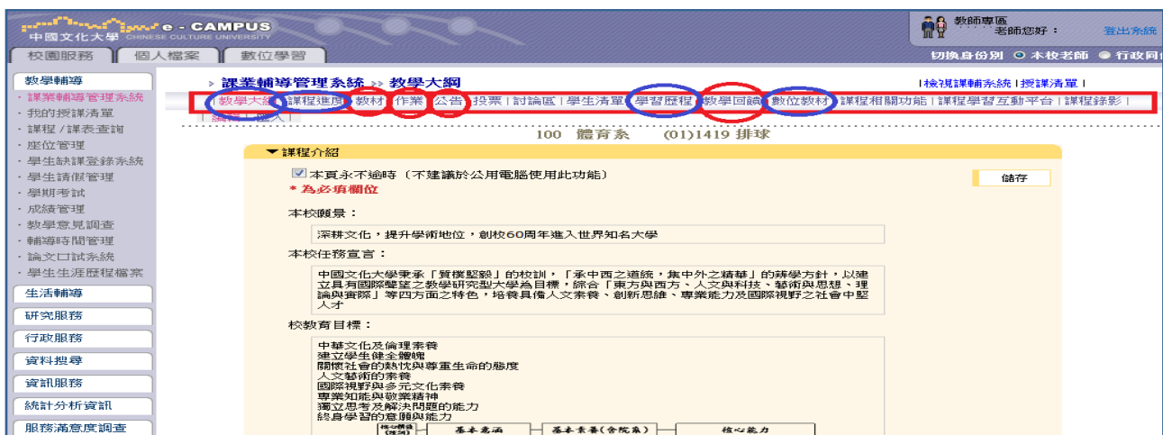
圖 3-2-2 課業輔導管理系統

本校於93年即建置「課業輔導系統」，任課教師須於選課前1週完成上傳教學大綱與教材。課綱內容包括：課程概述、目標、課程能力、授課方式、多元評分方式、參考書目、進度等，以利學生選課之參考。教師相關教材上傳，可供學生課前及課後研習，同時可利用「即時回饋系統」匿名反應教學意見，教師亦可線上即時回覆，並即時改進教學方法或內容，以提升學生學習成效(詳見圖3-2-2)。