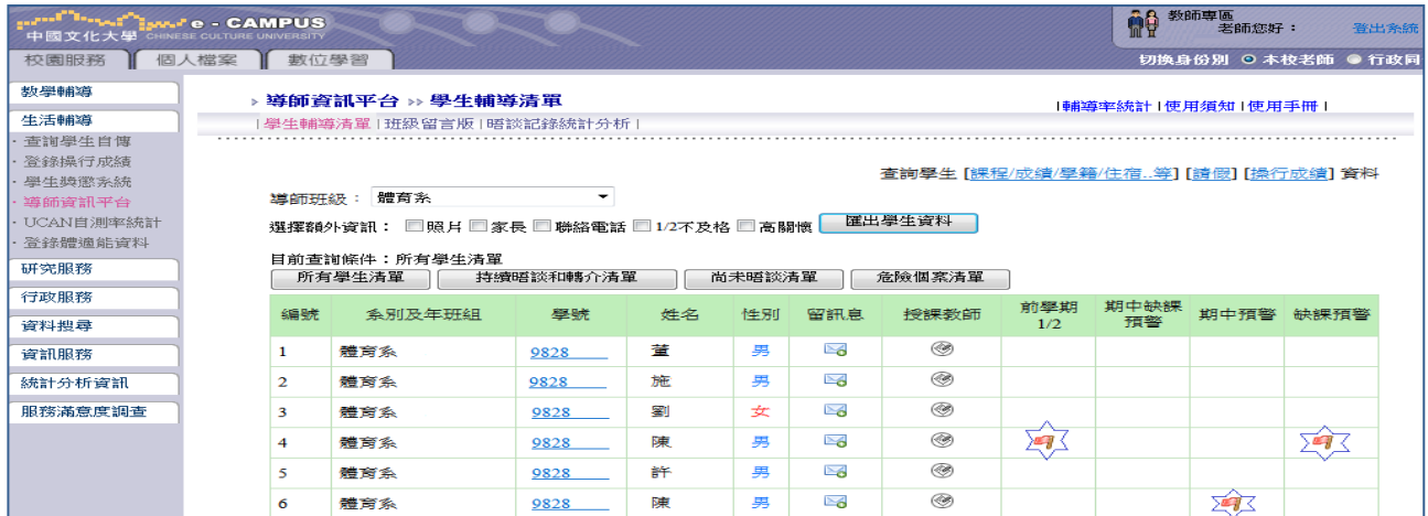
圖3-2-3 學生學習預警輔導平台