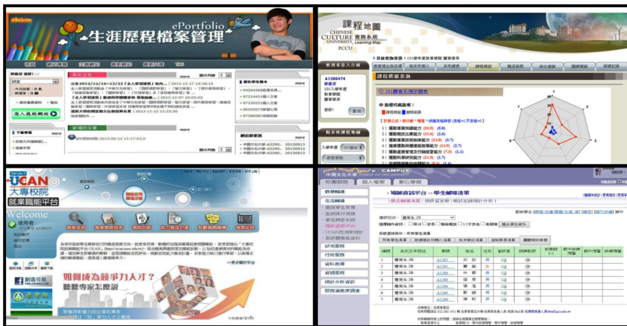
圖 3-2-1 四合 e 全方位主動學習平台

本校於 98 年完成「學生生涯歷程檔案」(e-Portfolio)，建置「課程學習地圖」，並將「大專校院職能診斷平台」(UCAN)納入，於 99 年度起與「導師資訊平台」整合成為「四合 e 全方位主動學習平台」(詳見圖 3-2-1)。