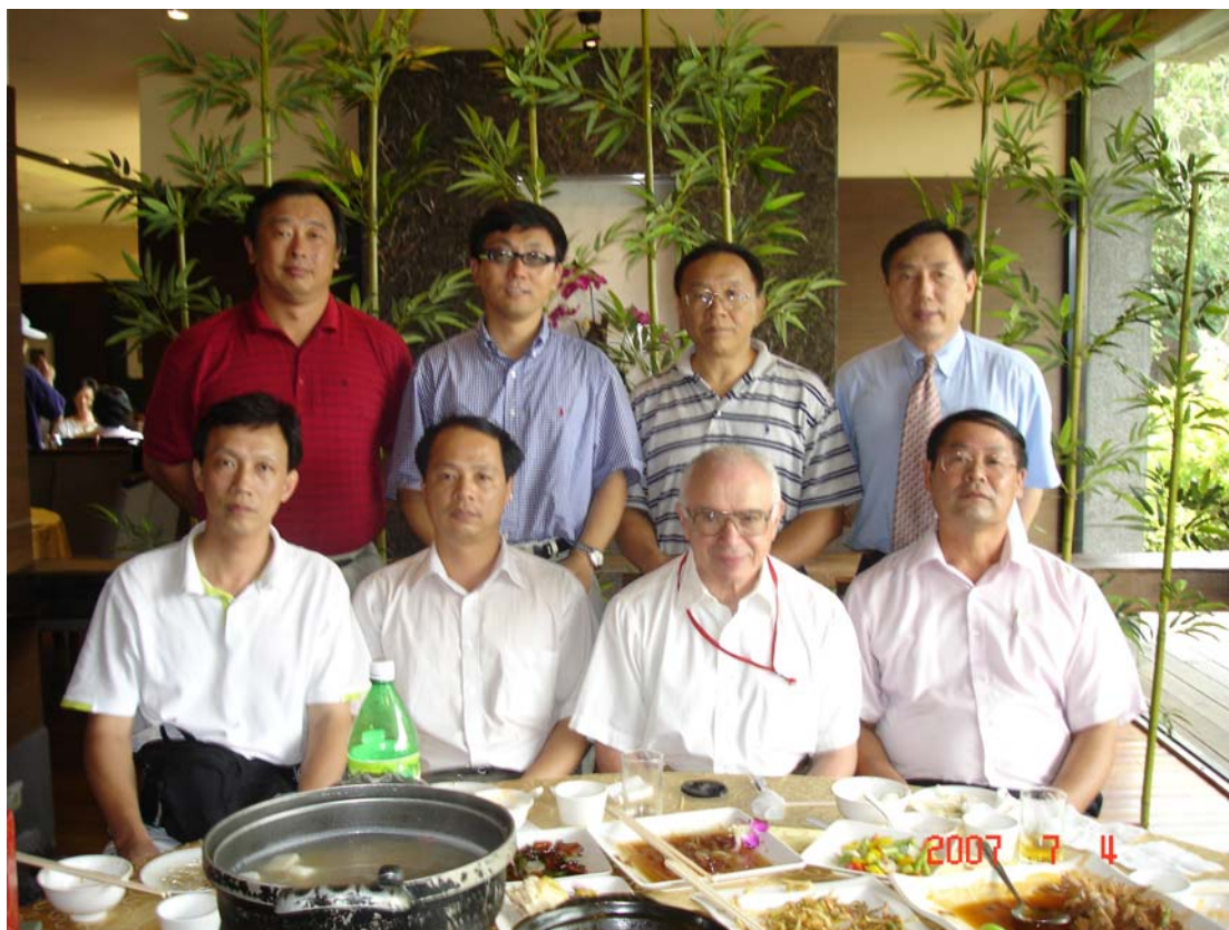
2007.7.4.歡迎午餐後合影留念（前排右二為 Vladimir, M. Zatsiorsky）

江主任、林所長並於宴後致贈禮品，感謝貴賓的到來。林所長並當面邀請 Zatsiorsky 教授下次前來參加運動生理學學會或運動教練研討會，並作專題演講。Zatsiorsky 教授此次應國際運動生物力學學會大會之邀，專題演講「Prehension Synergies: Biomechanics and Control」，其演講內容登錄在大會手冊第 S9 頁中。