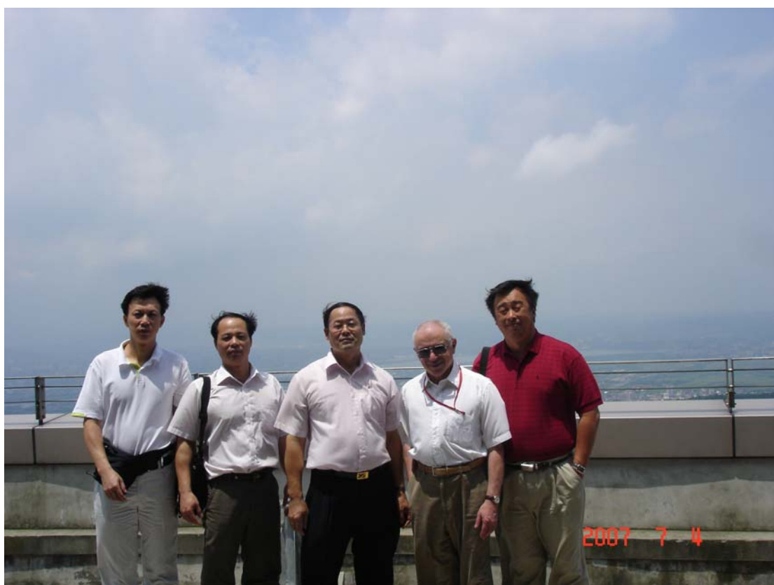
來訪貴賓合攝於中國文化大學體育館八樓陽台