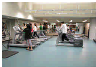
中國文化大學斥鉅資興建體育館提升體育教學與研究品質