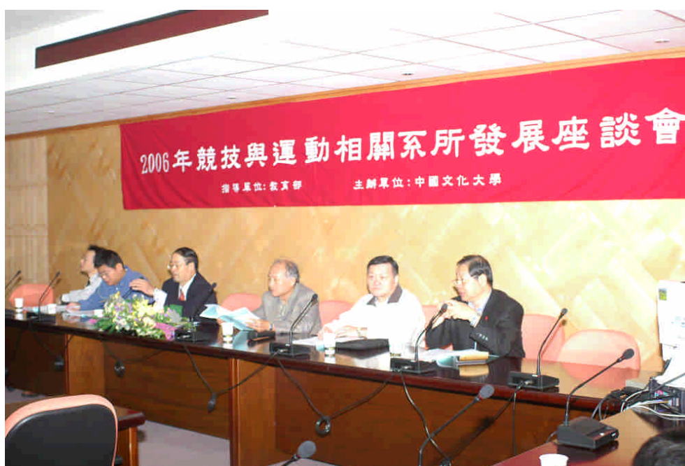
本所協助教育部主辦 2006 年競技運動相關系所發展研討會

在校外參加學術會議的主持人與演講人，對與會之青年學子具有相當的鼓舞作用，也是身為體育與運動教練相關從業人員對社會之回饋，本所教師今後亦將積極參與各項國內外學術活動，繼續發揮個人之貢獻與影響力。